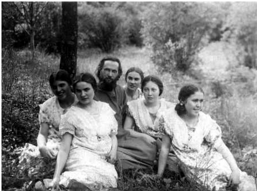
Основоположник молодёжного движения в нашем храме священномученик Василий Надеждин с духовными чадами

«Вот тебе, сынок, алгоритм: крестись, ходи в храм, даже не думай об алкоголе и наркотиках и не связывайся с плохими компаниями». Всё верно! Вспомните себя в молодости –