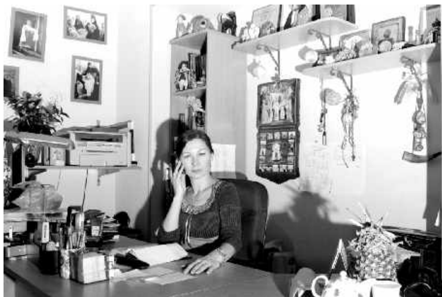
В рабочем кабинете

В настоящее время ещё один проект очень важен для нашего прихода в рамках социальной деятельности: помощь людям с ограниченными возможностями. На приходе уже появился мобильный подъёмник, который помогает переместить инвалида-колясочника в храм. Но мы хотим реализовать ещё один проект: транспортировка инвалида-колясочника. Для реализации