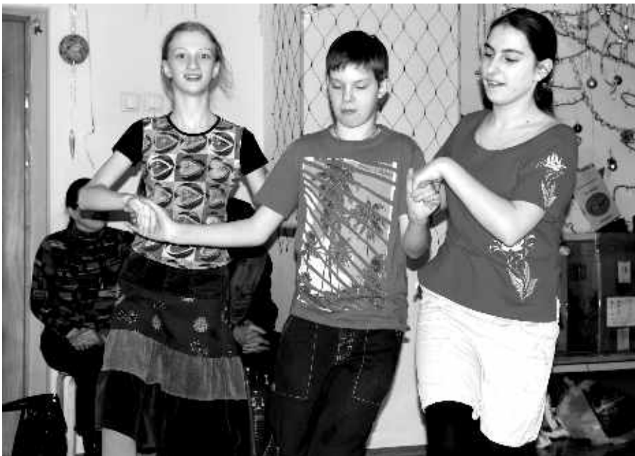
Репетиция перед балом

Пришёл рынок. Появилась аренда, вознаграждение преподавателям, западные методики по недешёвому франчайзингу. Спорт, интересы, общение стали дорогими. Участие в определённом объединении не