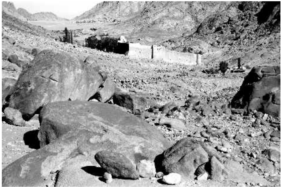
На пути к монастырю

Монастырь святой Екатерины – один из древнейших непрерывно действующих христианских монастырей в мире. Основан в IV веке в центре Синайского полуострова у подножия горы Синай (библейское название Хорив). Укрепленное здание монастыря было построено по приказу императора Юстиниана в VI веке. Насельниками его в основном