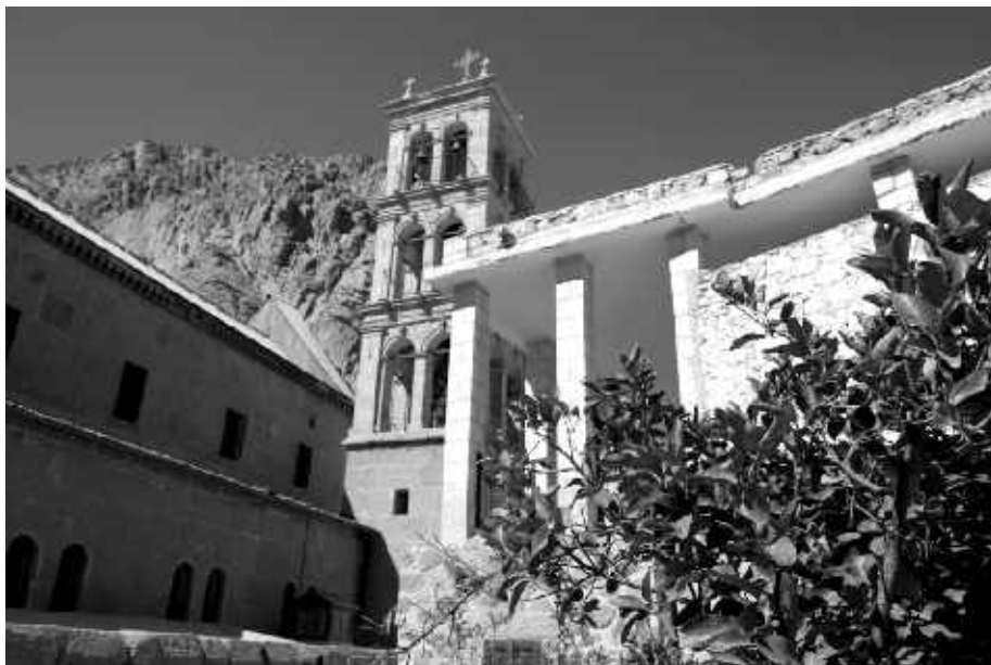
На территории монастыря

Главный храм монастыря (католикон), трёхнефная базилика,