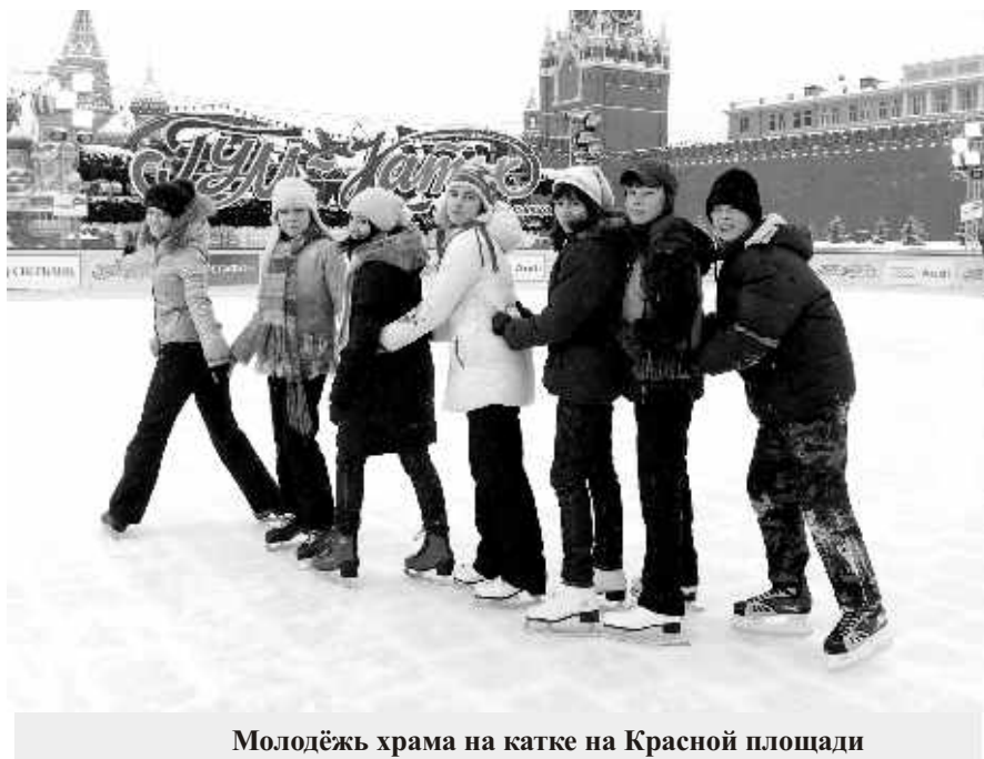
Молодёжь храма на катке на Красной площади

Шаблоны, стереотипы, псевдомудрые афоризмы и выражения, антисемейная пропаганда, насаждение в умы «войны